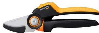
Sekator kowadełkowy X-series™, L (P941) ok. 125 zł